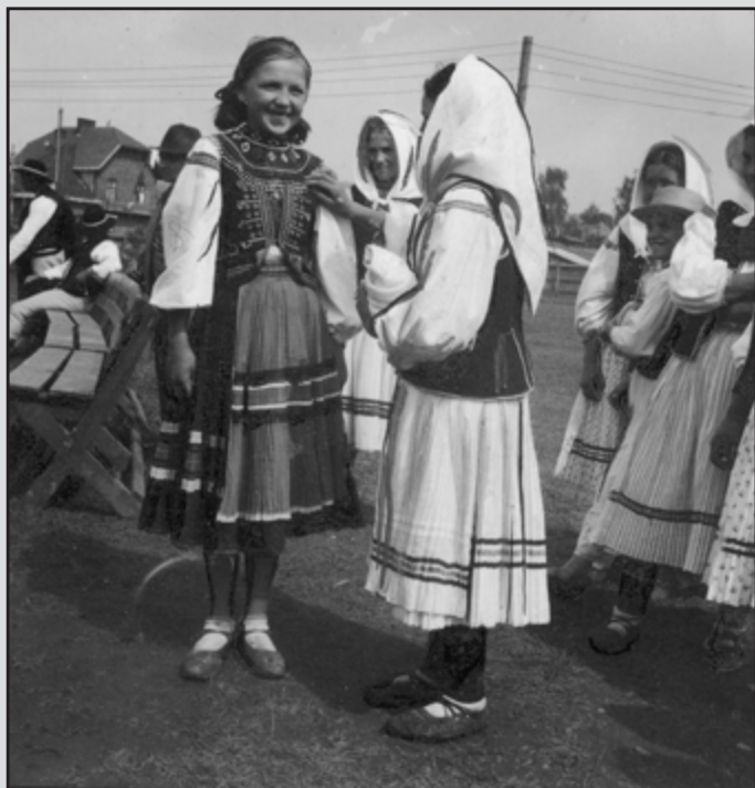
6. Grupa dziewcząt łemkowskich w odświęt- nych strojach regionalnych. (1936 r.)