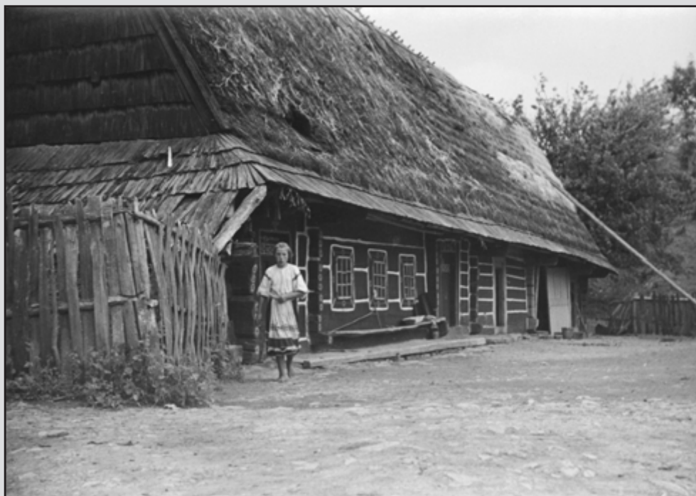
14. Radoszyce pod Komańczę, chata ĩemkowska (1936 r.)