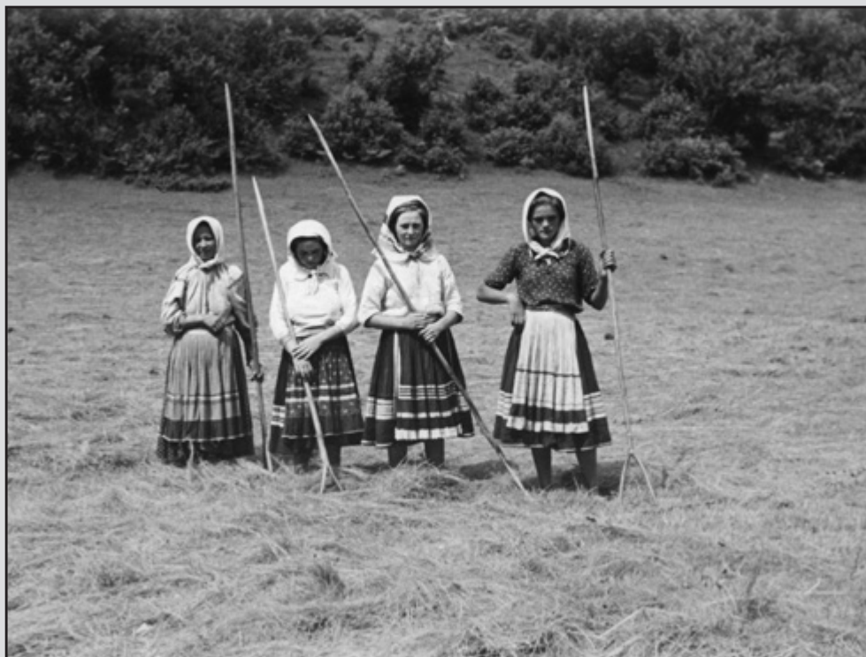
7. Dziewczęta łemkowskie, sianokosy, Komańcza. (1930–1939)