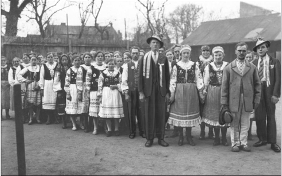
3. Delegacja Łemków przybyła na uroczystości święta 3 maja w Gorlicach. (3 V 1933).