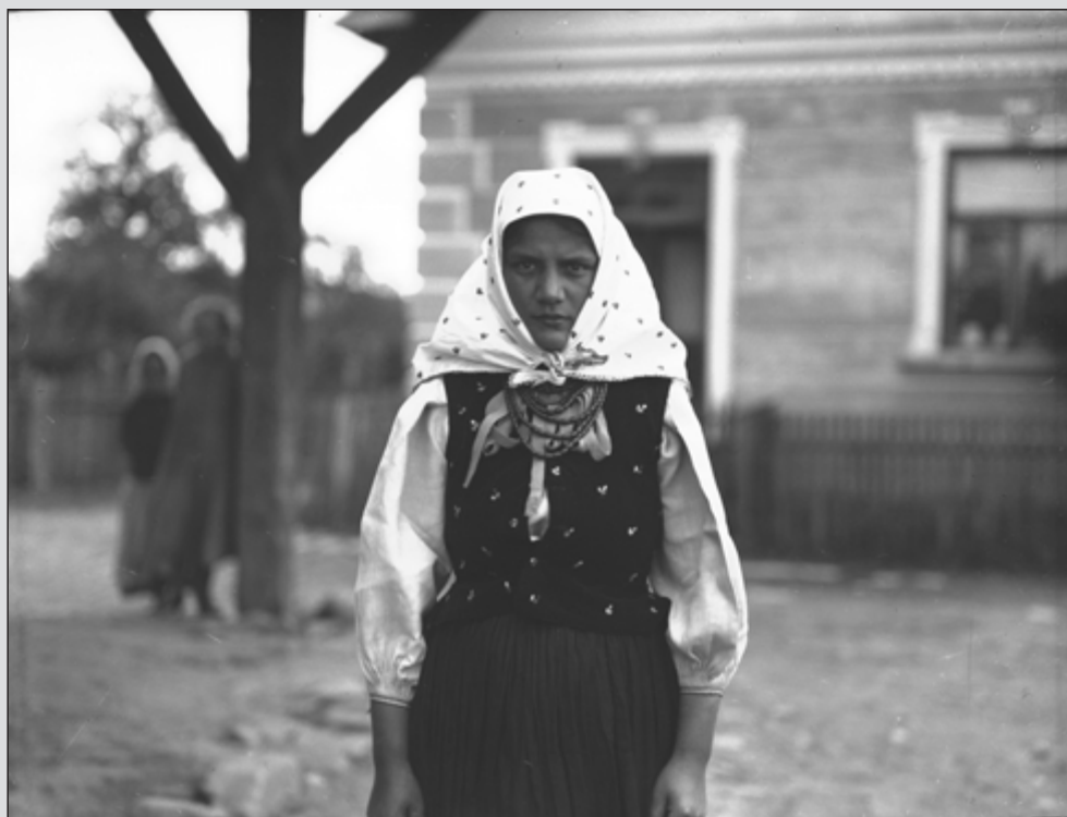
1. Młoda kobieta łemkowska w stroju regionalnym. Na zdjęciu widać typowe elementy łemkowskiego ubioru damskiego. Zdjęcie wykonane w 1932 r. w Jaśliskach.