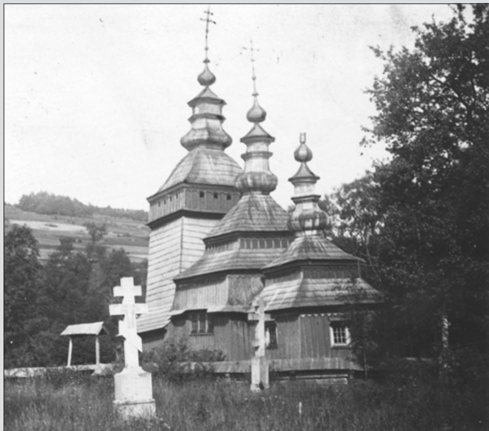
15. Cerkiew w Nieznajowej. Przed cerkwią widoczne groby prawosławne. (ok. 1925-1933).