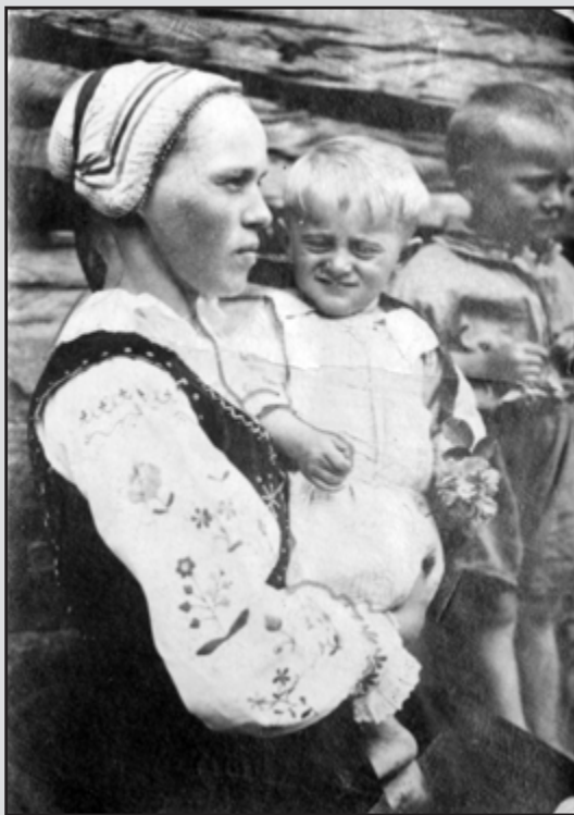
5. Łemkiny z dziećmi. Zamężna kobieta w stroju regionalnym i charakterystycznym czepcu na głowie. (1935 r.)