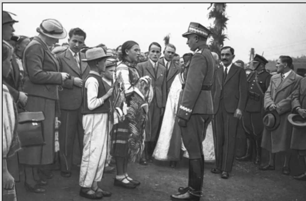
10. Obchody Święta Gór w Sanoku. Powitanie ministra spraw wojskowych gen. Tadeusza Kasprzycykiego przez dzieci łemkowskie. VIII 1936 r.