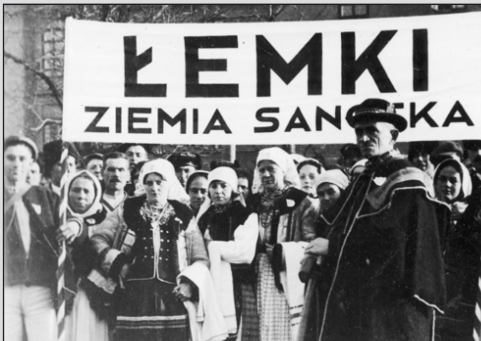
11 Uczestnicy zjazdu górali z Podhala, Podkarpacia i Huculszczyzny podczas pobytu w Krakowie. Grupa Łemków z ziemi sanockiej. XI 1934 r.