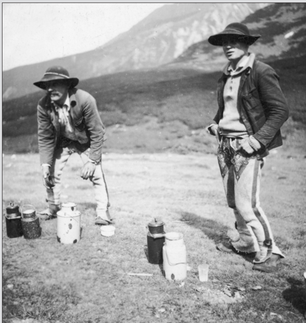
2. Dwaj mężczyźni z łemkowskiej grupy etnicznej. Zdjęcie wykonane prawdopodobnie na terenie Rusi Szlachtowskiej. Warto zwrócić uwagę na widoczne na fotografii wyraźne różnice w stosunku do tradycyjnego łemkowskiego stroju występującego w innych regionach Łemkowszczyzny. (1925–1939).