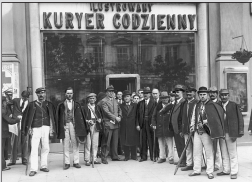
9. Delegacja Łemków z powiatów leskiego i sanockiego, która przybyła do Warszawy w sprawie utrzymania Sądu Okręgowego w Sanoku. Członkowie delegacji przed warszawskim oddziałem IKC we wrześniu 1934 r.