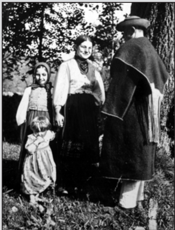
4. Rodzina Łemków z powiatu jasielskiego w strojach regionalnych. (1935 r.)