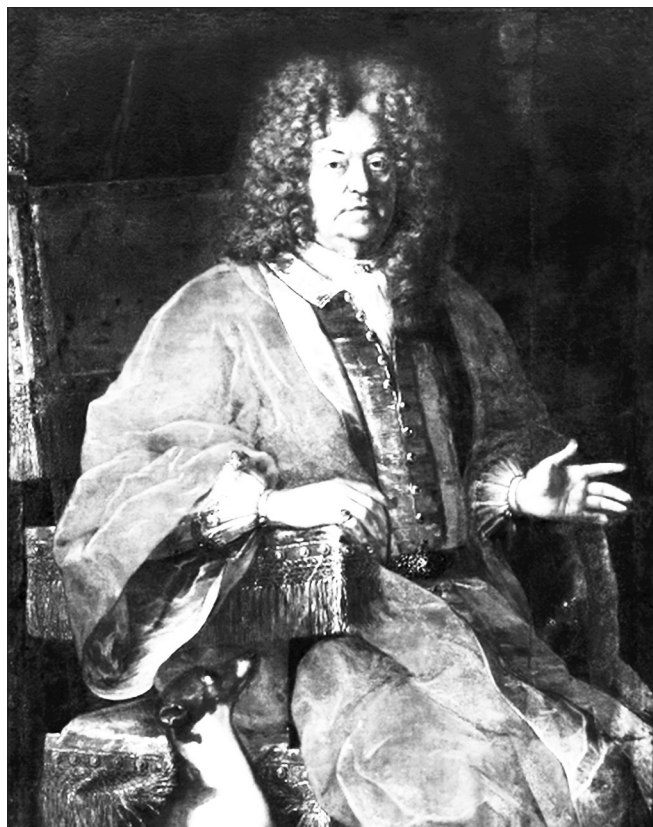
Jan Dobrogost Krasiński, mal. Michelangelo Palloni, ok. 1700, ze zbiorów Muzeum Pałacu Króla Jana III w Wilanowie