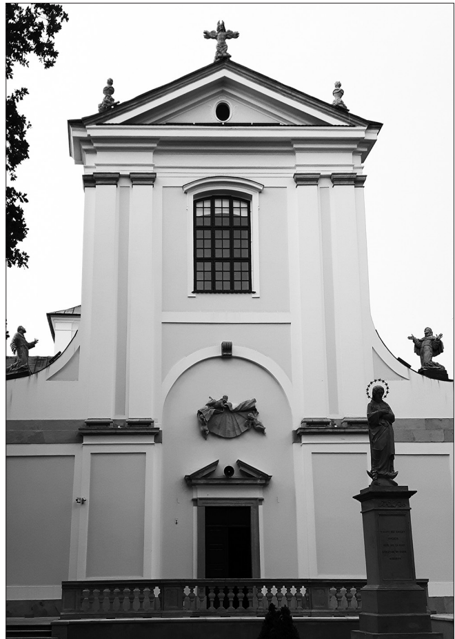
Elewacja frontowa kościoła reformatów w Węgrowie.

Kościół węgrowski jest typowym kościołem reformatów, zachowującym charakterystyczne dla tego zakonu elementy.