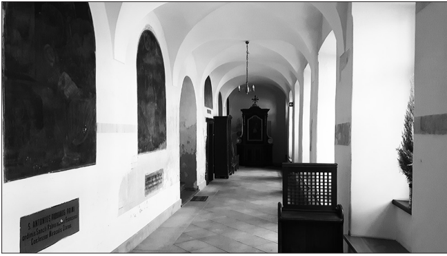
Krużganki w klasztorze reformatów w Węgrowie.

filarami, aby od wewnątrz przylegały one do ścian tworząc po bokach ciąg płytkich wnęk lub kaplic (stąd odmiana wnękowa lub kaplicowa) 28 . Kościół węgrowski wzniesiono w odmianie kaplicowej podobnie jak wcześniej kościoły reformatów w Warszawie (1680 r.), Białej Podlaskiej (1684 r.) i później w Miedniewicach (1748 r.) 29 . Ściany nawy są rozczłonkowane parami toskańskich pilastrów 30 . Podwójne pilastry są charakterystycznie nie tylko dla kościołów reformackich, ale w ogóle dla kościołów barokowych. Taki zabieg zastosowano w kościele Il Gesu i można go znaleźć w wielu kościołach w Polsce choćby w kościele św. Apostołów Piotra i Pawła w Krakowie (jezuitów) św. Bernardyna ze Sienny w Krakowie (bernardynów). W przypadku reformatów podwójne pilastry występują znacznie częściej w prowincji wielkopolskiej niż małopolskiej. Na skrzyżowaniu nawy z transeptem ślepa kopuła. Kopuła na skrzyżowaniu nawy z transeptem również jest elementem barokowym znanym z kościoła Il Gesu. Jednak w Węgrowie zastosowano ślepa kopułę a wynika to z przepisów budowlanych reformatów, które zabraniają kopuły w ich kościołach. Ślepa kopuła jest kopułą widoczną tylko od wewnątrz, w bryle zewnętrznej kościoła jest niewidoczna. Podobny zabieg stosują także karmelici bosy, którym przepisy budowlane również zabraniają kopuły w kościołach 31 .