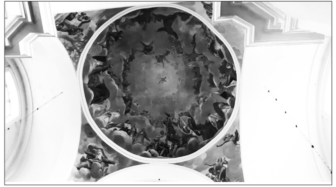
Ślepa kopuła w kościele reformatów w Węgrowie.